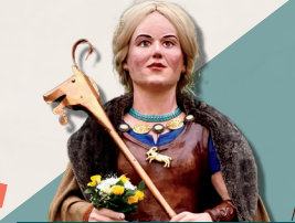
Mina des Dix Cailloux LA GORGUE