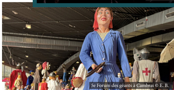
5e Forum des géants à Cambrai