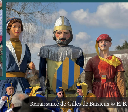
Renaissance de Gilles de Baisieux