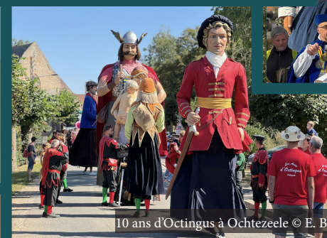
10 ans d'Octingus à Ochtezele