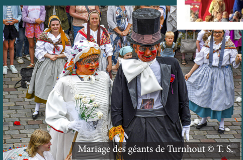
Mariage des géants de Turnhout