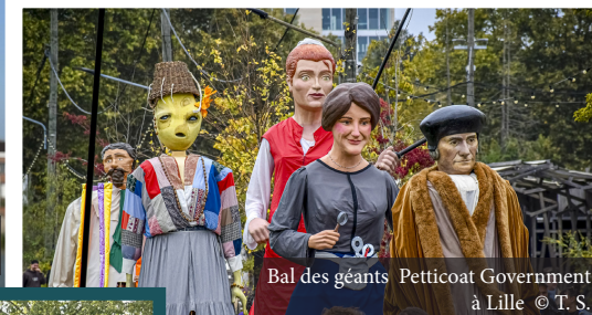
Bal des géants Petticoat Government à Lille