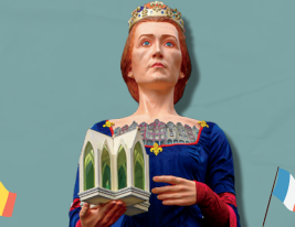
Mahaut d'Artois ARRAS