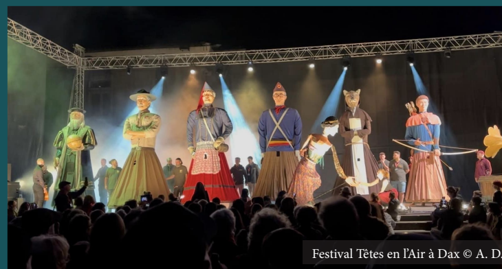
Festival Têtes en l'Air à Dax