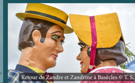
Retour de Zandre et Zandrine à Basècles