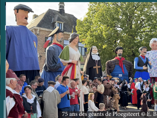
75 ans des géants de Ploegsteert