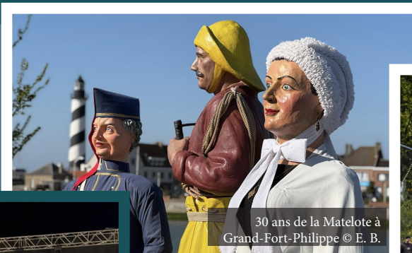
30 ans de la Matelote à Grand-Fort-Philippe