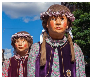
Les jumelles des Marolles © P. Dupuich.