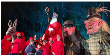
Fête de la Saint-Nicolas de Villeneuve d'Ascq (© E.B.).

S 2 Villeneuve d'Ascq (F) , Fête de la Saint-Nicolas, avec la sortie de Saint-Nicolas, l'Âne et le Père Fouettard.