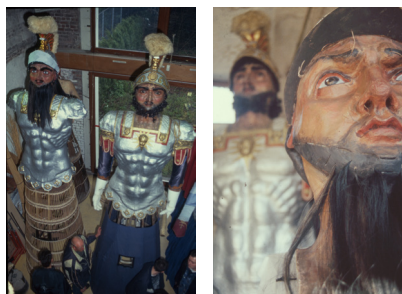
Ateliers de Stéphane Deleurence en 2001 © S. Deleurence.

Les clones ou répliques sont généralement réalisés pour sauvegarder et préserver un géant original fatigué et devenu trop fragile pour défiler. Nous pouvons prendre en exemple les géants de Cassel (F): Reuze Papa (1827) et Reuze Maman (1860), clonés au début en 2000 et 2001.