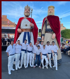
Sigebert 1er de Lambres-lez-Douai (F)