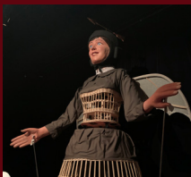
Hélène Dutrieu de Tournai (B)