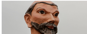
Guillaume de Rubrouck (© A.D.).

Rubrouck (F) , Ducasse, avec la sortie de Guillaume de Rubrouck.