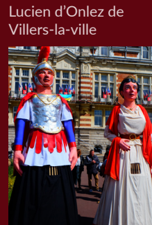
Bassus et Bassée de la Bassée (F)