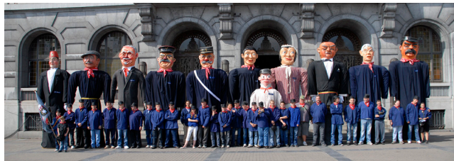
Les géants de Charleroi en 2009 ©M Smets.

Enfin, à Charleroi, une famille classique (parents et un enfant) existe mais autour d'elle, un ensemble de géants est venu se greffer. Ensemble, ils forment donc une grande famille de géants. C'est également le cas pour les géants du Meyboom, à Bruxelles, ou encore Liège, avec l'existence d'un groupe de géants qui peut être assimilé à une famille, avec comme point de départ, un couple de géants.