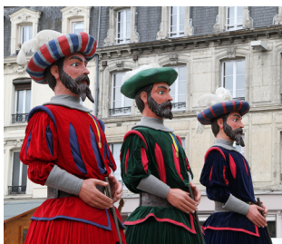
Les Picantins de Compiègne