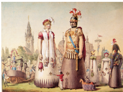
Les géants de Douai en 1819, illustration de Bertcher d'après E.Wallet.

Le couple donnera naissance à trois magnifiques enfants, appelés « petites figures ». Jacquot, l'aîné, apparaît en 1675, Fililon, l'unique fille, en 1687, suivie par Binbin, l'attachant benjamin de la famille Gayant.