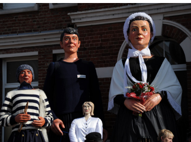
Fiu, Gut, Soeur et la Matelote

En 2000, la Matelote (1995) de Grand-Fort-Philippe épouse son voisin, l'Islandais de Gravelines (1988).