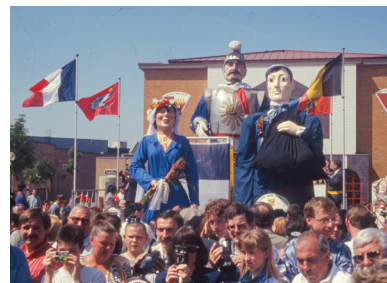
Mariage de Joséphine la Peûle et Celten le Trimard

Muguette de Prouvy (F.) et l'Avocat de Papignies (B.) se sont unis en 2012, ainsi que Miss Cantine de Nieppe (F.) et Pimpon de Lessines (B.), en 2013.