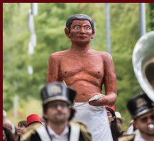
P'tit Scribe du Louvre Lens (F)