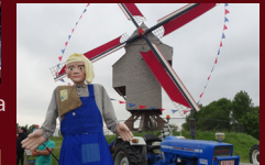
Le Meunier de Thimougies (B)