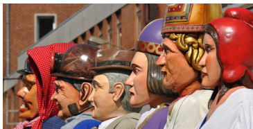
Les géants de la Province de Liège.

Ma 15 Liège (B) , Fêtes du 15 août en Outre-Meuse, Cortège à 14h30, avec les Géants de la Province de Liège et leurs invités.