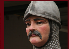
L'arbalétrier de Tournai (B)