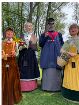
Les géants d'Hazebrouck

À Nivelles, Goliath (devenu l'Argayon par la suite) attesté en 1457, reçoit une épouse en 1645 et un fils le siècle suivant. Le Goliath de Grammont, quant à lui, mentionné dès 1577, a reçu son épouse et son enfant la même année, en 1807.