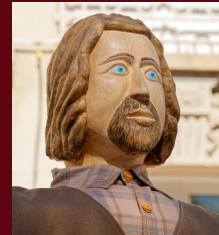
Joseph de Nieppe (F)

D 25 Lu 26 Saint Jans Cappel (F) , Ducasse, avec la sortie de Reuze Maman.