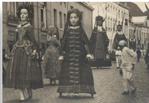
La famille des géants de Malines au début du 20e siècle.

La couverture de cette année ayant été réalisée à Malines afin de mettre en avant la plus ancienne famille de géants de France et de Belgique.